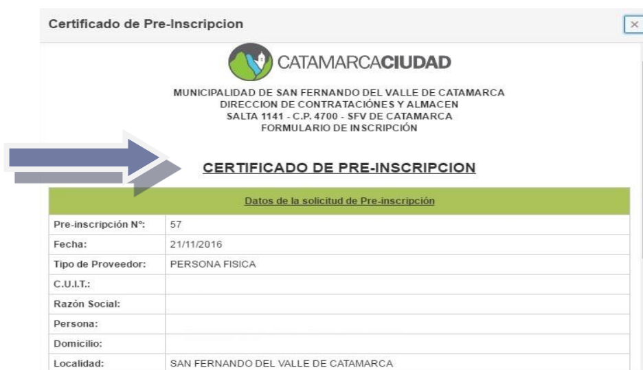
Ilustración 5: Certificado de Pre-inscripción que habilita a participar en Concursos de Precios y Licitaciones Públicas.

Contrataciones, solo a efectos de verificarlos datos antes cargados en el soporte digital.