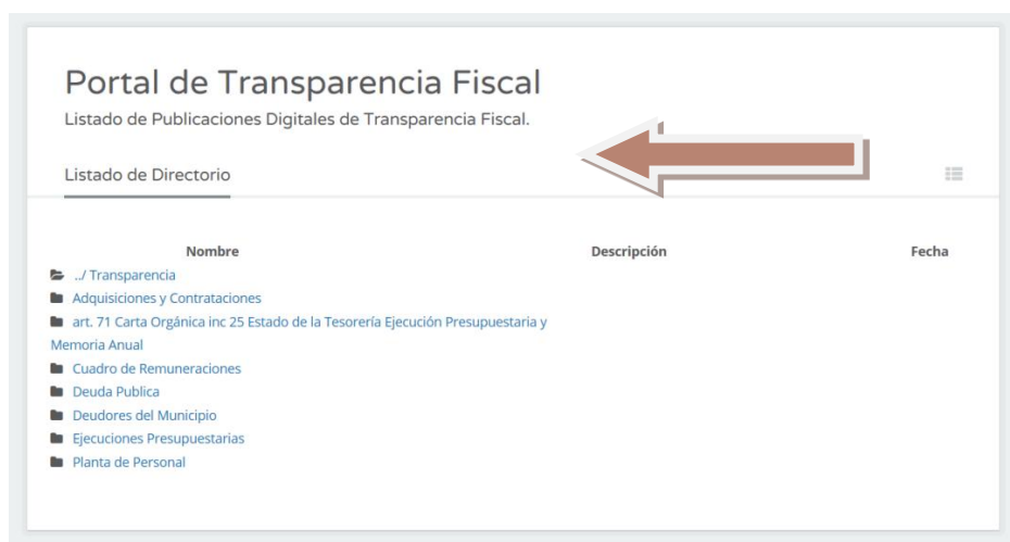
Ilustración 6: Portal de Transparencia Fiscal - Municipalidad de SFV de Catamarca - www.sfvcatamarca.gob.ar

Hoy por hoy se publica la totalidad de las compras que realiza el municipio, las altas y bajas de personal permanente y transitorio, los deudores del Municipio, el estado de la Deuda Pública, Ejecuciones presupuestarias y la Cuenta General del Ejercicio con todos sus anexos incluida la memoria anual.