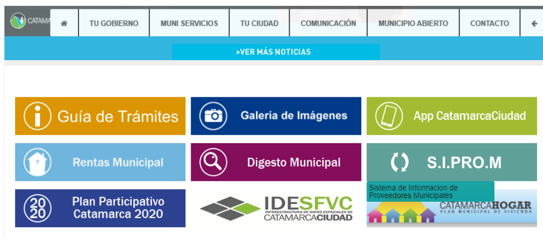
Ilustración 4: ícono de acceso al S.I.PRO.M. en la página web del municipio, www.sfvcatamarca.gob.ar

web municipal www.catamarcaciudad.gov.ar , y el acceso a la inscripción se realiza a través de un ícono especial denominado “S.I.PRO.M”.