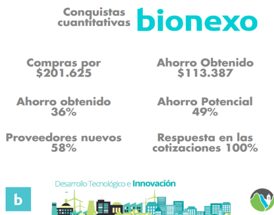
Cuadro 1: Estadísticas obtenidas a través de la plataforma BIONEXO de las compras realizadas por la Municipalidad de S.F.V.C. en diciembre 2016.