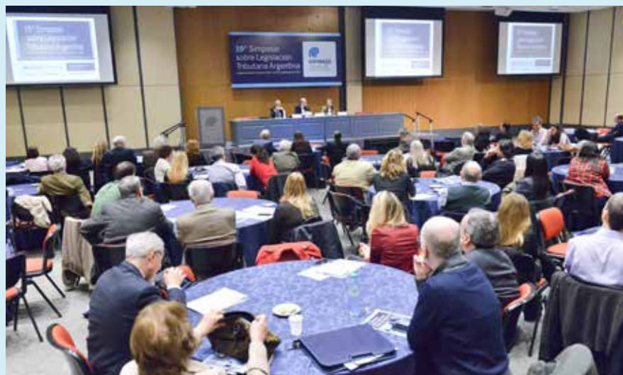
En 2017 se desarrolló la 19° edición de esta jornada tributaria.